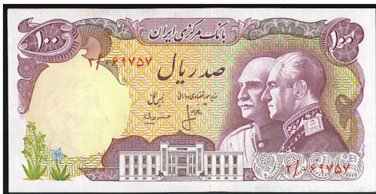
100 rijálů – otec a syn z dynastie Pahlaví

Šáh se narodil 26.10.1919, po základním vzdělání studoval ve Švýcarsku a od r. 1936 byl připravován k samostatnému vládnutí. Přestože nastoupil na trůn v r. 1941, teprve v roce 1967 byl korunován na šáhínšáha Íránu. Korunovace byla zřejmě odložena nejen kvůli skutečnosti, že panovník se nechtěl dát korunovat, dokud se jeho země nedostane z nejhroší bídy (jak tvrdí propagační turistické brožurky), ale zřejmě hlavně kvůli korunovačnímu ceremonálu, kde musí být přítomen syn, který je prohlášen za nástupce.